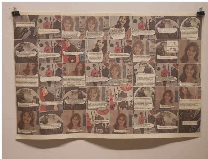
Slika 1.

autorstva u eri Photo-shop-a, da li zvanični organi kulture u ovoj ili bilo kojoj drugoj zemlji mogu da prođu nekažnjeno za „malo popravljanja” i, očit, malo prisvajanja tuđeg dela jer nemilosrdi sat kapitalizma kuca pet do dvanaest do isteka kratkog roka, ovaj rad gromoglasno govori. Forma stripa savršeno paše sadržaju ovog rada. Neočekivana po-